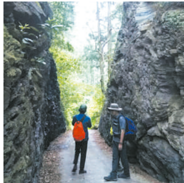
香肌の史跡 珍布峠でトレッキング

参加費 2,000円 ※受付時徴収 (傷害保険料、昼食代、エイドでの地域 特産品 等が含まれます。)