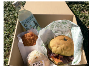
屋食(おいしかバーガーなど)