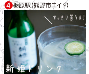
新姫ドリンクなど