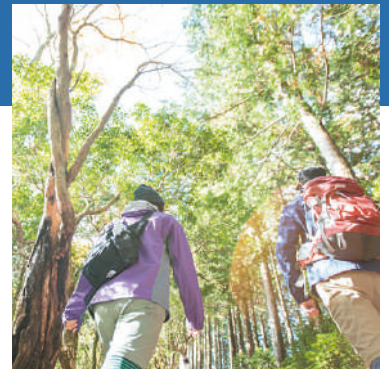
宮川中流域の総門山でトレッキング