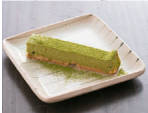
抹茶入りチーズケーキ