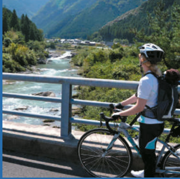
香肌峡でサイクリング

ジャパンエコトラック「伊勢 熊野」のルートである 宮川・香肌峡をめぐる自転車ツアー