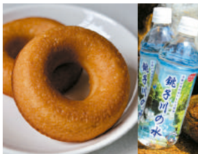
卵卵ふわあ〜むのドーナツなど